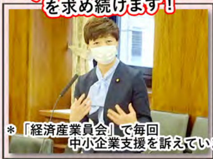
*「経済産業委員会」で毎回 中小企業支援を訴えています。