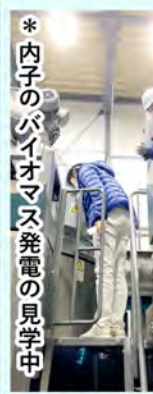
*内子のバイオマス発電の見学中

今国会では、県内各地から「急斜面に太陽光パネルが無理に設置され、土砂災害が心配。相談した役場も設置者が分からず困っている。」などの声を頂いたので、対応しています。そもそも『再エ特措法』では、自治体の権限が無いので、災害や景観を壊す恐れがある設置を「防ぐ力」を持てるよう「自治体の権限」強化を提言しています。そうやって安心安全に再エネを増やしていければ、林業家がバイオマス発電、農家が太陽光発電・ソーラーシェアリングなどで収入が増えて、地域も元気になります。