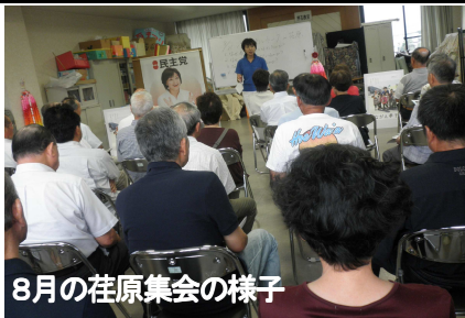
8月の荏原集会の様子